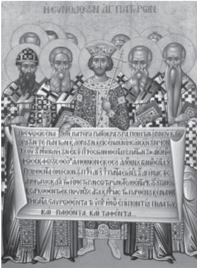
Keizer Constantijn en de heilige vaders van het Concilie van Nicea.