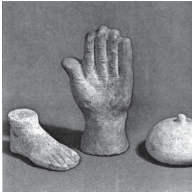
Ex-voto's die de goden werden geschonken als dank voor een genezing.

Natuurlijk kreeg ook de antieke mens niet altijd zijn zin. Anders dan een christen was zijn verklaring voor het uitblijven van de gevraagde gunst niet dat de godheid nu eenmaal beter wist wat goed voor hem was. Nee, hij legde de verantwoordelijkheid