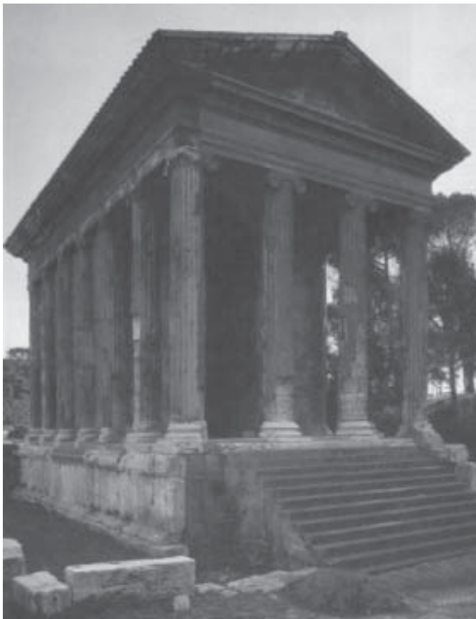
Romeinse tempel in de buurt van Ponte Rotto (van circa 100 v.C.).

Mythen kunnen ook de etiologie van maatschappelijke instellingen geven. Waarom mochten Griekse vrouwen niet stemmen? Historisch is het fenomeen uitstekend te begrijpen. De kantonnale staat die de polis was, berustte op weerbaarheid. Geen wonder dus dat alleen mannen polisleden, politai , waren. Niettemin zorgde een mythe voor een afdoende verklaring. In het conflict tussen Athena en Poseidon om het bezit van Attika, hadden de vrouwen voor de zeegod gekozen. Daardoor hadden zij zich gediskwalificeerd en werd hun door de goden voor altijd het stemrecht ontnomen. In elk geval moet de oude Grieken worden nagegeven dat zij de politieke asymmetrie problematiseerden.