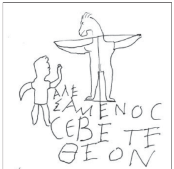
Graffito in het keizerlijk paleis te Rome: 'Alexamenos vereert God'. Hij werd kennelijk om zijn bizarre geloof bespot (200-300 n.C.).

Ondanks deze gunstige factoren had het christendom na bijna drie eeuwen niet meer dan 10% aanhang onder de bevolking.