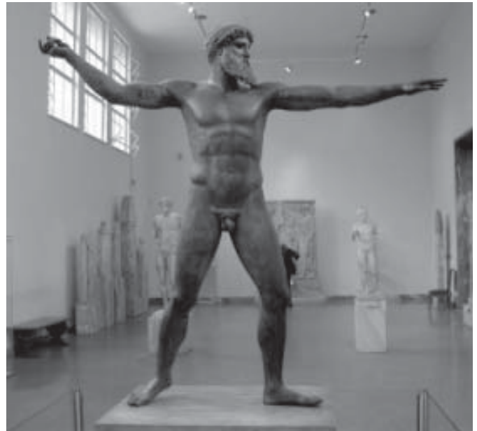
Zeus in het Nationaal Museum in Athene.

De goden die via de mythen hun rollen en hun rituelen kregen toebedeeld, waren verre van almachtig. Ze hadden slechts de evidente beperkingen van het menszijn overwonnen, ziekte, veroudering en dood. De favoriete metonymie voor hen is dan ook de 'onsterflijken', athanatoi . In de uitbeeldingen zien zij er als supermensen uit. Dit antropomorfisme maakt hen mooier en groter dan de stervelingen. In hun perfectie kunnen zij zich ook rustig blootgeven. Hun naaktheid is een demonstratie van tijdloosheid. Kleding fixeert immers mensen in de tijd, zoals we ervaren als we om oude foto's van onszelf moeten gniffelen. Naaktheid daarentegen vereeuwigd. Die omstandigheid verklaart ook het afleggen van kleren door Griekse sporters. Bij de Spelen, die steeds religieuze festivals waren, werden deze atleten even halfgoden.