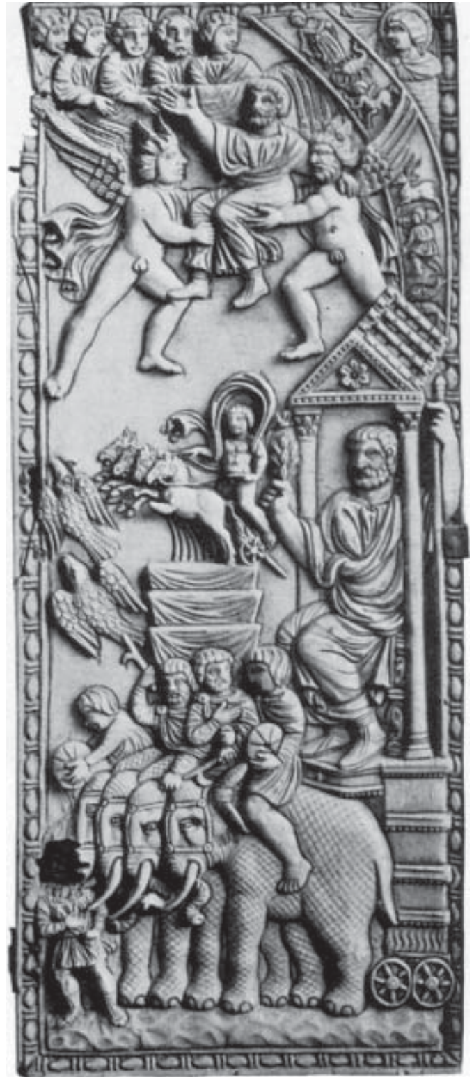
Een begrafenisstoet waarin de beeltenis van de keizer op een wagen wordt meegevoerd. Boven is te zien hoe de vergoddelijkte heerser ten hemel wordt gedragen.

Christelijke godsdiensthistorici plachten het vroeger zo voor te stellen dat het heidendom op sterven na dood was. De lege zielen van de antieke wereld zouden hebben zitten hunkeren naar de openbaring van de Onbekende God. Hadden de Atheners al niet een altaar voor dit opperwezen opgericht? In feite was dit altaar