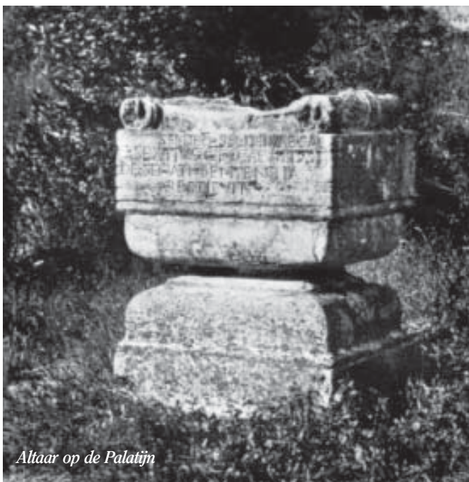
Altaar op de Palatijn

Hoe wisten Grieken en Romeinen wie de goden waren? Zij hadden geen heilig boek waarin de allerhoogste(n) zich openbaarden. Hoe de goden werkten, wisten zij uit de talrijke mythen. Veel van die oude verhalen geven een oorzaak, aitia . Deze 'etiologie' kan heel triviaal zijn, bijvoorbeeld als zij een naam verklaart. De Egeïsche Zee heet zo omdat Aigeus zich in wanhoop om zijn dood gewaande zoon in het water stortte. Waarom de spin zo naarstig weeft, wordt uitgelegd door het verhaal van Arachne, die het waagde een weefwedstrijd met Athena aan te gaan. Toen het meisje de godin van het handwerk dreigde te overtreffen, vernielde deze haar weefsel en veranderde haar in een spin. Waarom de negers zwart zijn? Wel, Phaëton, bastaardzoon van de zonnegod Helios, dwong van zijn vader de toestemming af één keer de zonnewagen te besturen. In zijn onervarenheid raakte hij uit de koers, kwam te dicht bij 'Ethiopië' en verschroeide voor altijd de